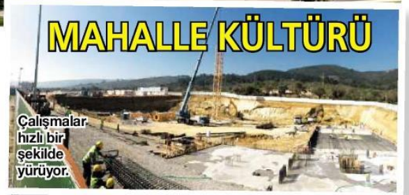
Çalışmalar hızlı bir şekilde yürüyor.

insanı insan yapan değerlere saygı ve özen gösteren, çevreye uyumlu, ülkenin ve dünyanın geleceğini düşünen, farklı ve katma değeri yüksek konut proje çalışmaları ile yaşama özen katmaya devam ediyoruz. İzmir 'de riskli bölgelerin sayısı küçümsenemeyecek düzeyde olmakla birlikte maalesef sağlıksız binalar insan hayatını tehdit etmeye devam ediyor. Biz de bu bağlamda Aryom İnşaat olarak, sorumluluk bilinciyle hareket ediyor ve Gaziemir 'de Çatalkaya Korusu'nda hayata geçirdiğimiz bu proje ile sosyo-ekonomik ve kültürel değişimi en iyi şekilde yapmak için çalışıyoruz" ifadesini kullandı.