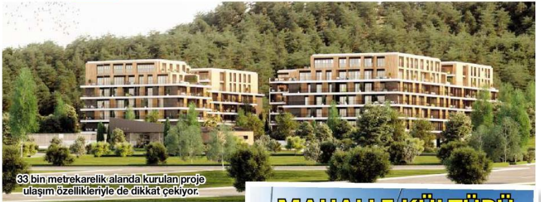
33 bin metrekarelik alanda kurulan proje ulaşım özellikleriyle de dikkat çekiyor.

insanı insan yapan değerlere saygı ve özen gösteren, çevreye uyumlu, ülkenin ve dünyanın geleceğini düşünen, farklı ve katma değeri yüksek konut proje çalışmaları ile yaşama özen katmaya devam ediyoruz. İzmir 'de riskli bölgelerin sayısı küçümsenemeyecek düzeyde olmakla birlikte maalesef sağlıksız binalar insan hayatını tehdit etmeye devam ediyor. Biz de bu bağlamda Aryom İnşaat olarak, sorumluluk bilinciyle hareket ediyor ve Gaziemir 'de Çatalkaya Korusu'nda hayata geçirdiğimiz bu proje ile sosyo-ekonomik ve kültürel değişimi en iyi şekilde yapmak için çalışıyoruz" ifadesini kullandı.